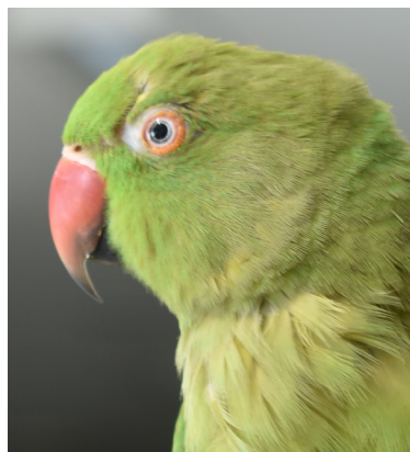
Kuvassa: Kauluskaija

Toimittanut: KSEY ry:n hallitus Graafinen suunnittelu, taitto: Suvi Ekholm suvi.ekholm@gmail.com Painatus: Digitaalipaino Seppo Talja Oy Painos: 800 kpl